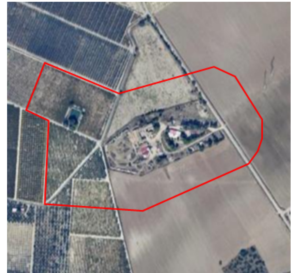
Ortofoto con proposta di riperimetrazione dell'area di rispetto