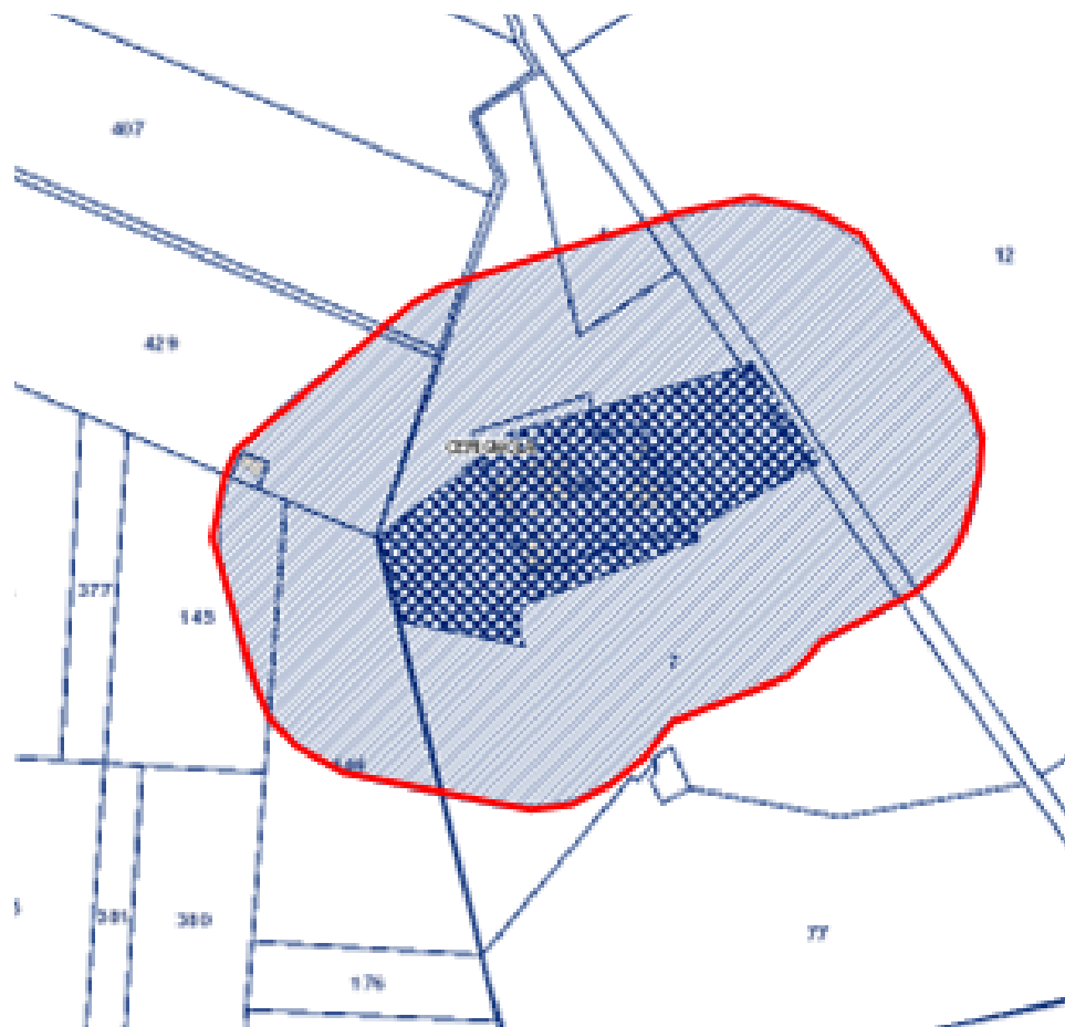
Catasto con perimetrazione da PPTR