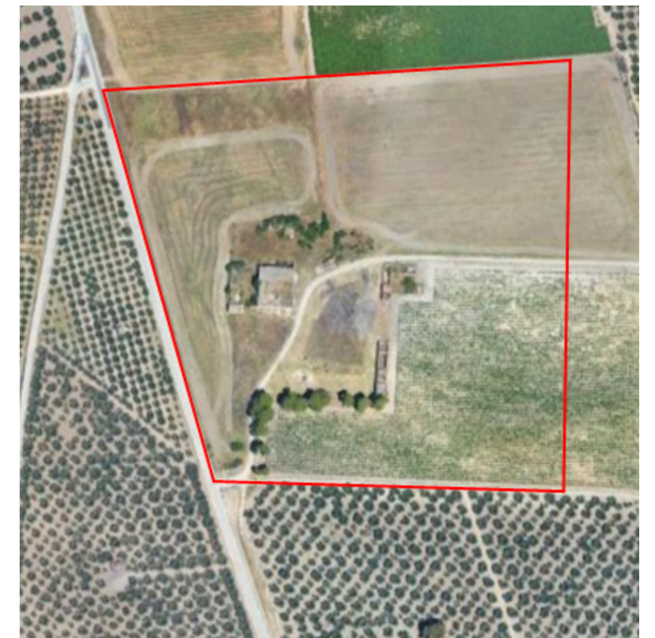
Ortofoto con proposta di ripermimetrazione dell'area di rispetto