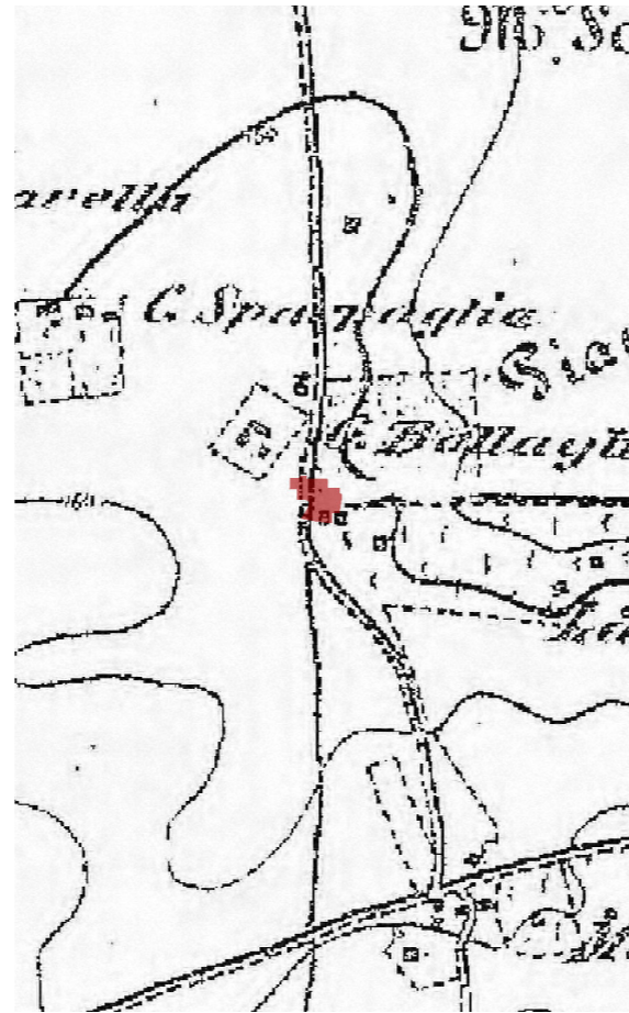
IGM fine '800