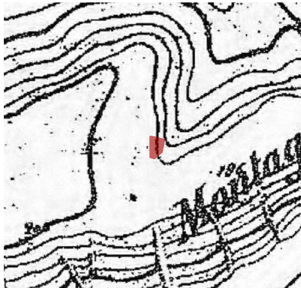
IGM fine '800