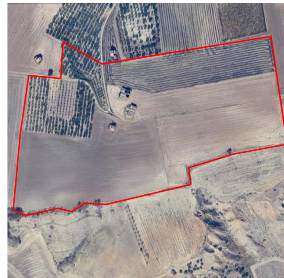
Ortofoto con proposta di riperimetrazione dell'area di rispetto