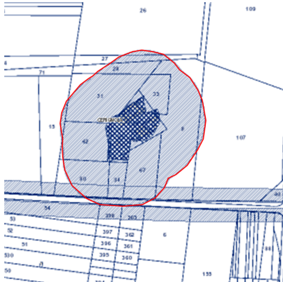
Catasto con perimetrazione da PPTR

La Masseria, di epoca compresa fra il XIX-XX secolo, è composta da diversi corpi di fabbrica in muratura portante. Il corpo principale, posto a nord è sviluppato su due piani, ha subito delle parziali modifiche, con l'inserimento di una tettoia a falde con tegole, che si affaccia su una struttura probabilmente usata in origine come deposito, di pianta quadrangolare, anch'essa con tettoia piana. A sud ovest del complesso sono collocate quelle che probabilmente erano le stalle e i depositi della masseria, in muratura portante e a pianta quadrangolare, attualmente sprovviste di infissi e inutilizzate. Il bene, che ha subito nel tempo notevoli modifiche che ne hanno mutato l'aspetto originario, è in mediocre stato di conservazione. Il PPTR la segnala come testimonianza della stratificazione insediativa, sito di interesse storico culturale . Dato il forte grado di compromissione del bene se ne propone l'eliminazione dal sistema di tutele del PPTR.