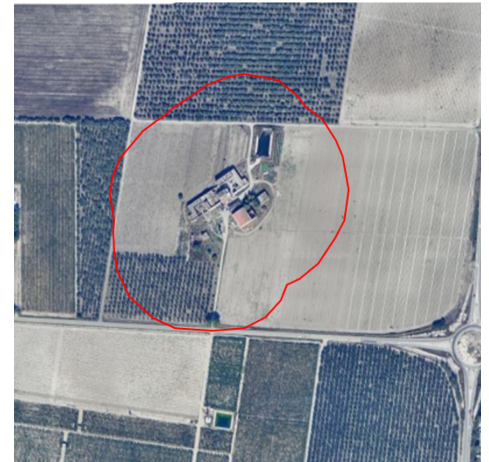
Ortofoto con individuazione dell'area di rispetto