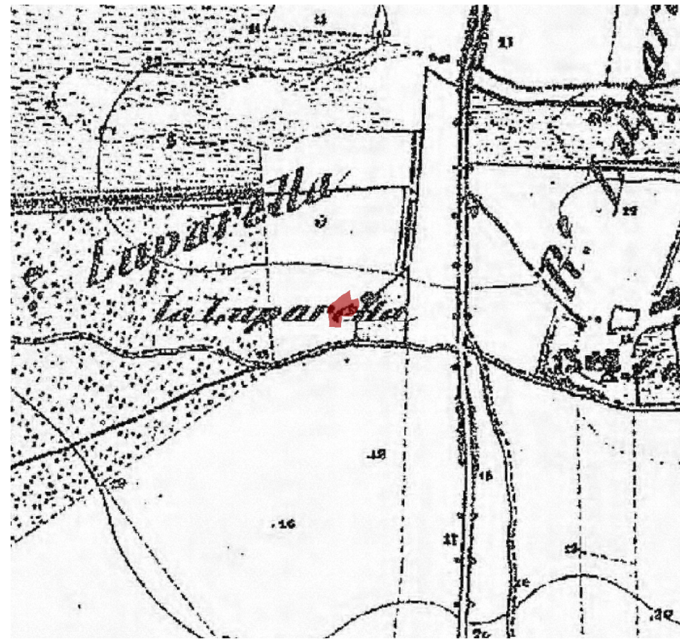
IGM fine '800