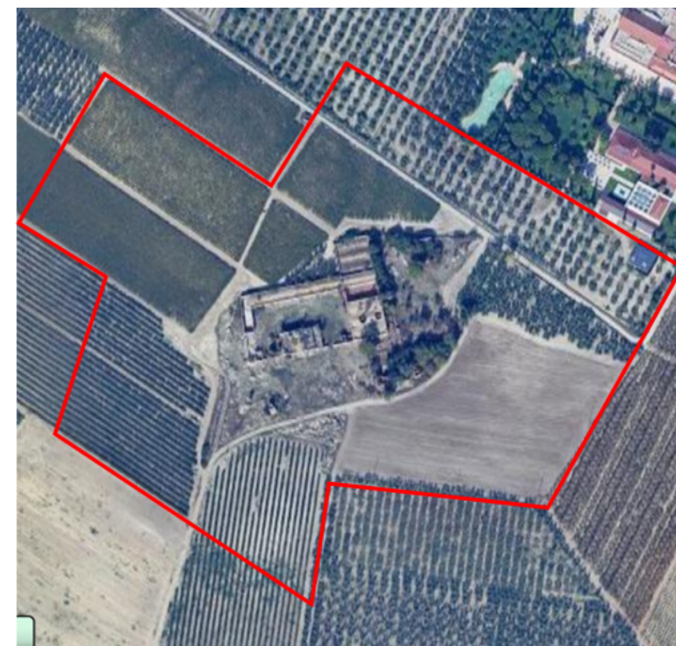
Ortofoto con individuazione dell'area di rispetto