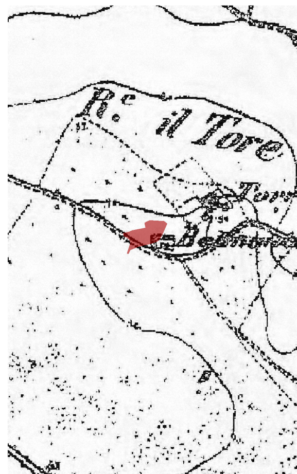
IGM fine '800