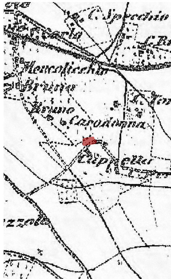
IGM fine '800