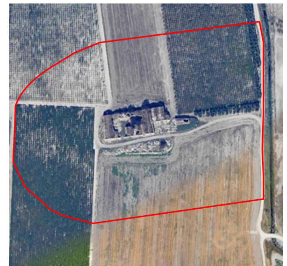
Ortofoto con individuazione dell'area di rispetto