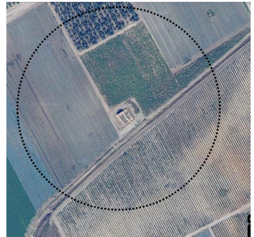
Ortofoto con proposta di ripermetrazione dell'area di rispetto