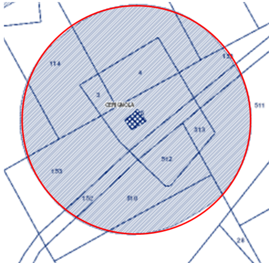
Catasto con perimetrazione da PPTR

Dato il forte grado di compromissione del bene, se ne propone l'eliminazione dal sistema delle tutele del PPTR.