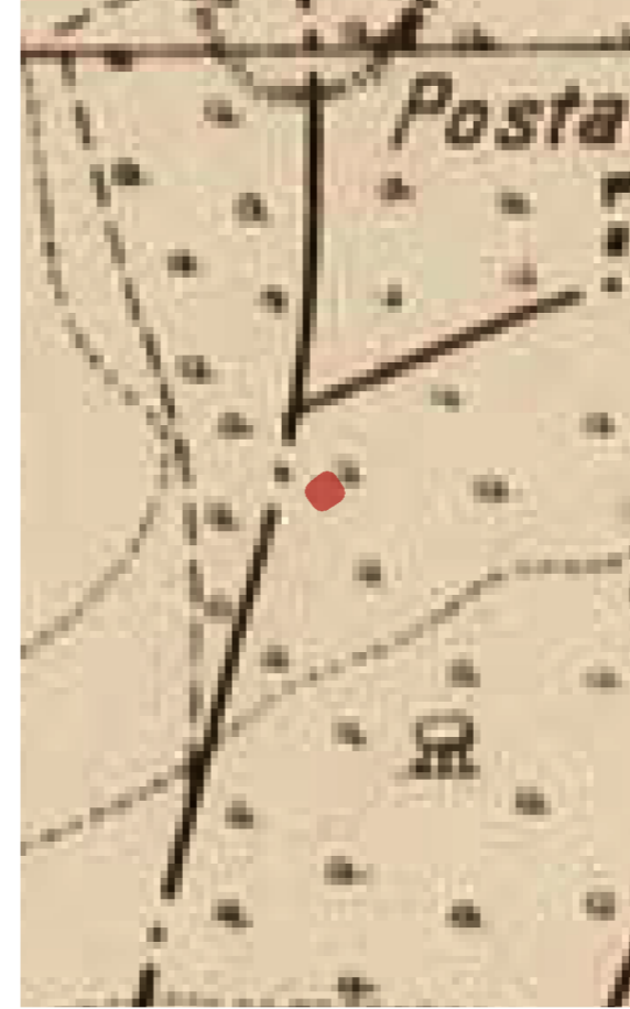
IGM fine 1913