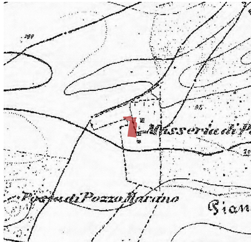
IGM fine '800

Il PPTR segnala il bene come testimonianza della stratificazione insediativa, sito di interesse storico culturale. Dato il forte grado di compromissione del bene se ne propone l'eliminazione dal sistema di tutele del PPTR.