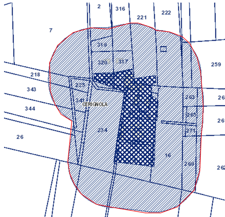
Catasto con perimetrazione da PPTR