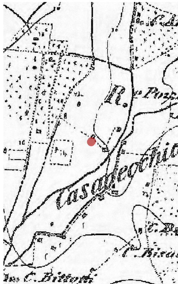
IGM fine '800