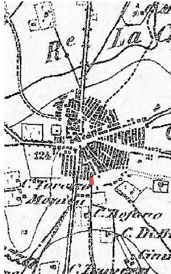
IGM fine '800