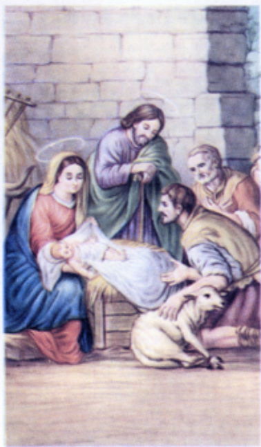
L'ADORAZIONE DEI PASTORI