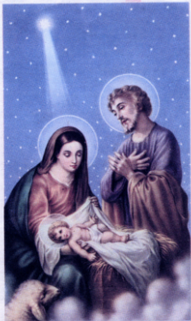
NATIVITA' DI GESU' BAMBINO