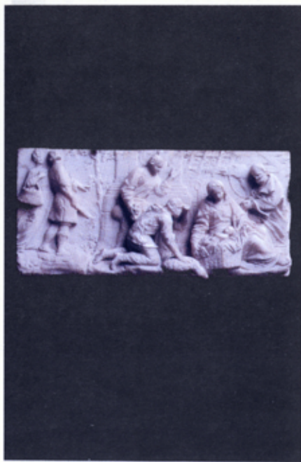
ADORAZIONE DEI PASTORI