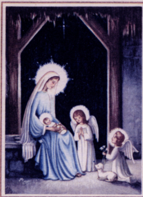
© The Religions of the Cenacle