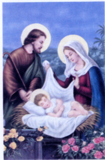
NATIVITA' DI GESU' BAMBINO

"... e lo avvolse in fasce e lo pose a giacere in una mangiatoia perchè non c'era posto per loro nel diversorio."