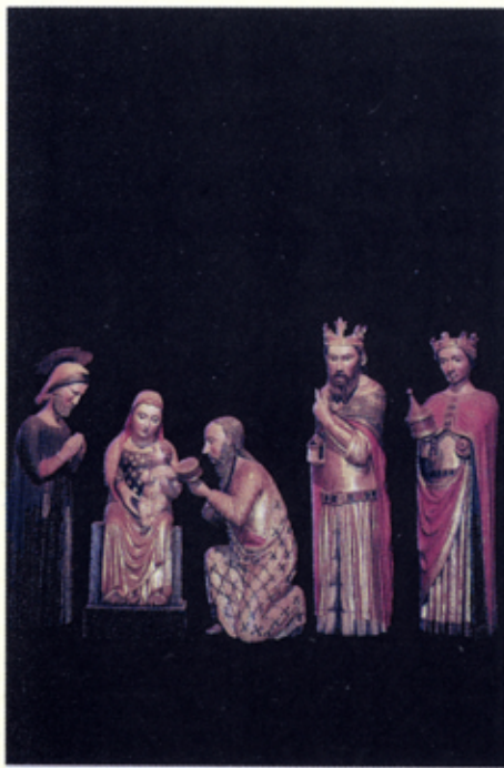
ADORAZIONE DEI MAGI