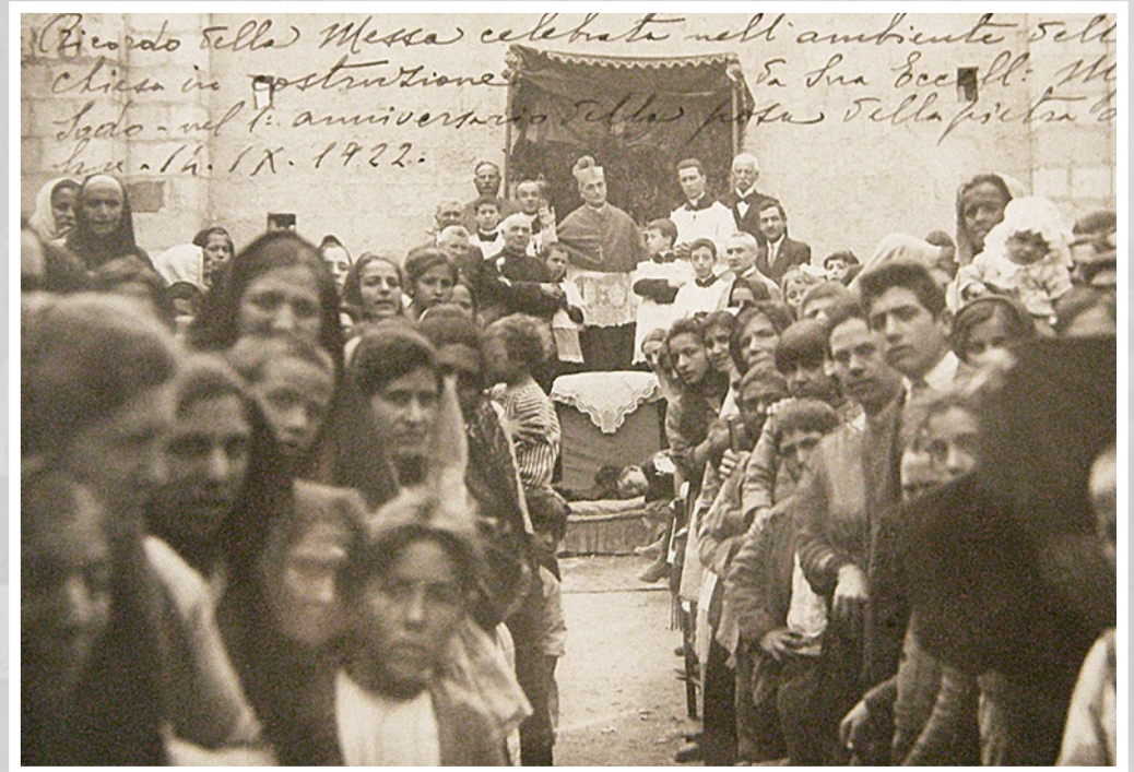
1922. Messa nel cantiere della chiesa del Buon Consiglio

le Terziarie Domenicane crescono di numero, divenendo un punto di riferimento per le numerose associazioni parrocchiali.