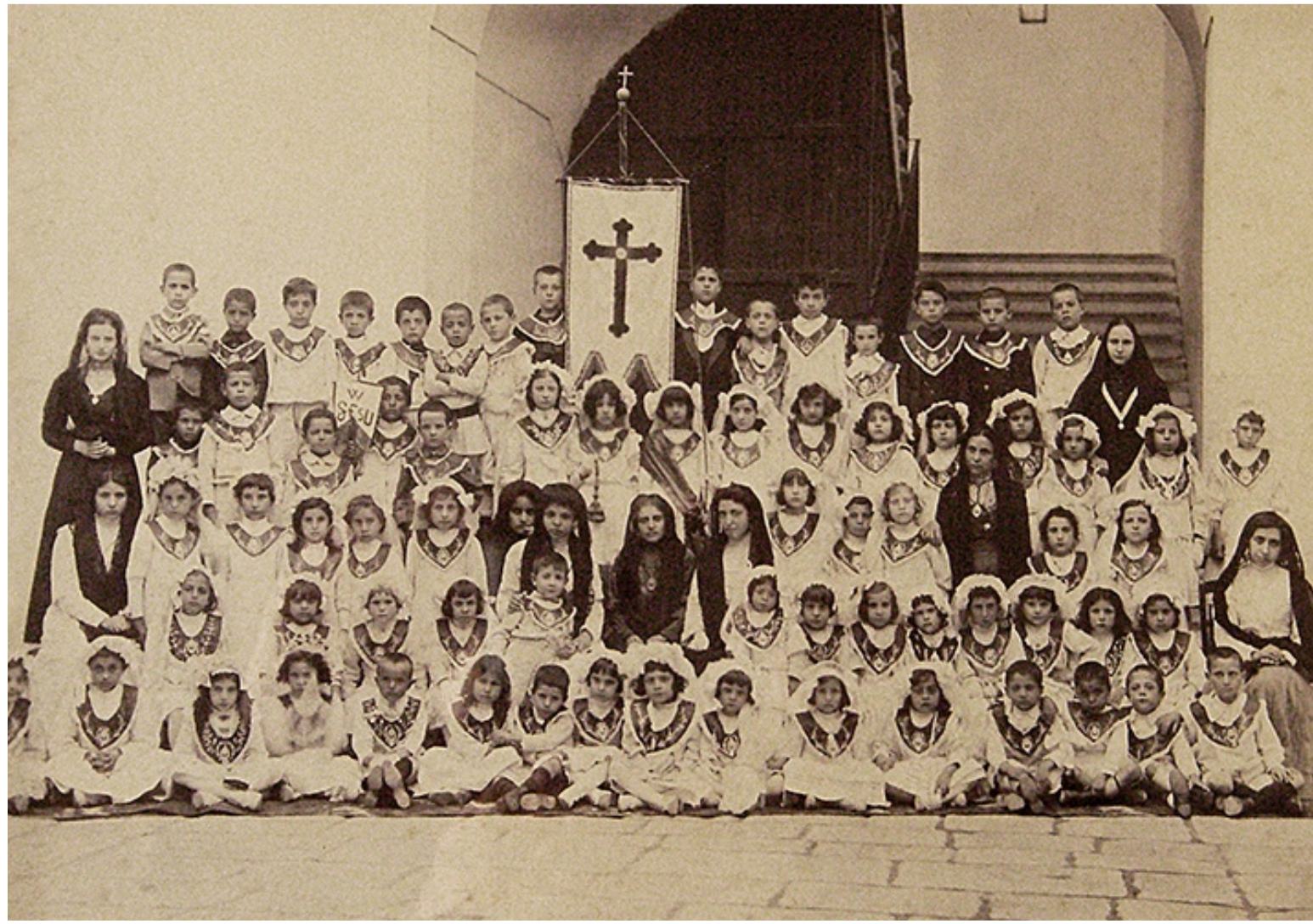
1912. Pia unione dei Paggi del SS. Sacramento