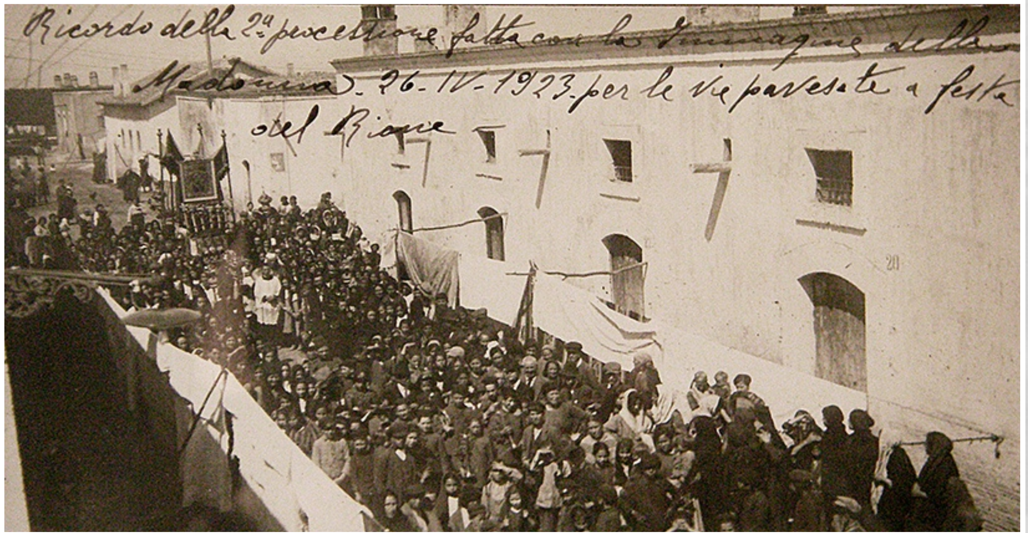
1923 Processione con l'immagine della Madonna del Buon Consiglio