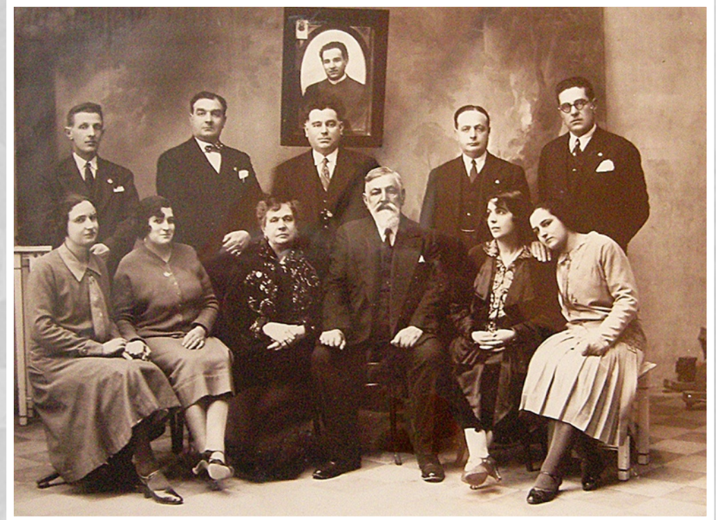
la famiglia Palladino

Nel 1908 il vescovo sceglie don Antonio per lanciare una moderna azione pastorale nella città, affidandogli l'incarico di costituire un oratorio salesiano secondo il metodo educativo di don Bosco. Nella primavera del 1909 don Antonio fa il suo ingresso nella chiesa di San Domenico e vi resterà fino alla sua morte. La parrocchia abbracciava allora – oltre alla zona della Cittadella, sorta proprio a ridosso della chiesa – anche i quartieri periferici Pozzocarrozza e Senzacristo, di ultima costruzione, dove si erano stabilite le migliaia di braccianti provenienti soprattutto dal nord barese che, sradicati dal loro contesto socio-culturale, erano maggiormente inclini all'agnosticismo e più sensibili alle idee socialiste.